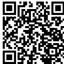
Video der Eventlocation

Die Location Dampfdom in der Motorworld München